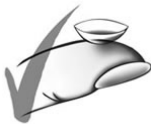
Fig1: Posizione corretta